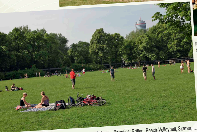
Stadtpark Jenaer Paradies: Grillen, Beach-Volleyball, Skaten, ...