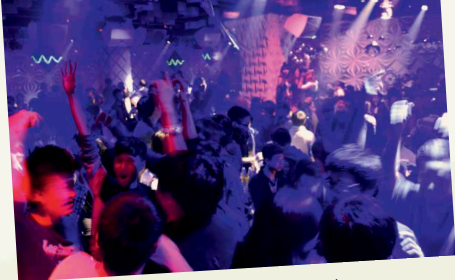
Konzerte, kulturelle Angebote und durchtanzte Nächte