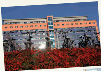
Studentenwohnheim: 26 Studentenwohnheime in Jena, davon dieses auf dem Campus