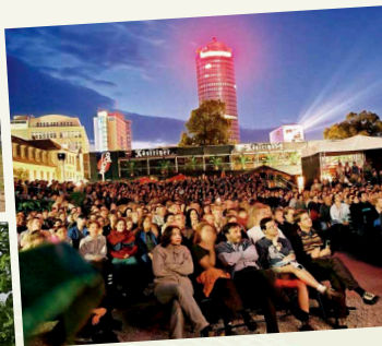
Kulturarena: Konzerte und OpenAir-Kino im Sommer