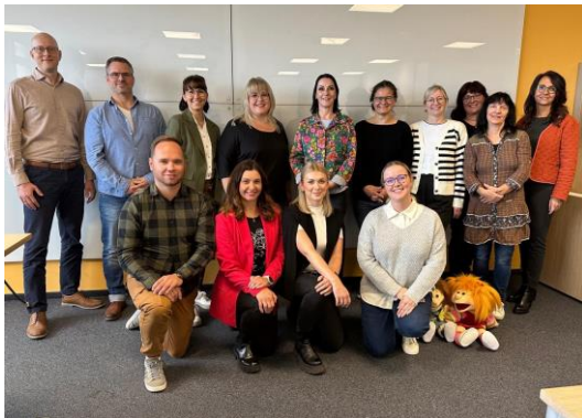
Teilnehmerinnen und Teilnehmer des 6. Zertifikatskurses „Betriebliche/r Gesundheitsmanager/in (FH)“ an der Ernst-Abbe-Hochschule Jena

In diesem Jahr haben 15 Teilnehmerinnen und Teilnehmer den 6. Zertifikatskurs „Betriebliche/r Gesundheitsmanager/in (FH)“ an der Ernst-Abbe-Hochschule (EAH) Jena erfolgreich beendet. Mit dem Abschluss des Kurses erhielten die Teilnehmenden ein anerkanntes Hochschulzertifikat. Herzlichen Glückwunsch an alle Absolventinnen und Absolventen!