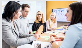
Business Intelligence Lab