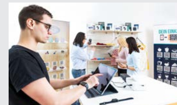
Innovation Living Lab