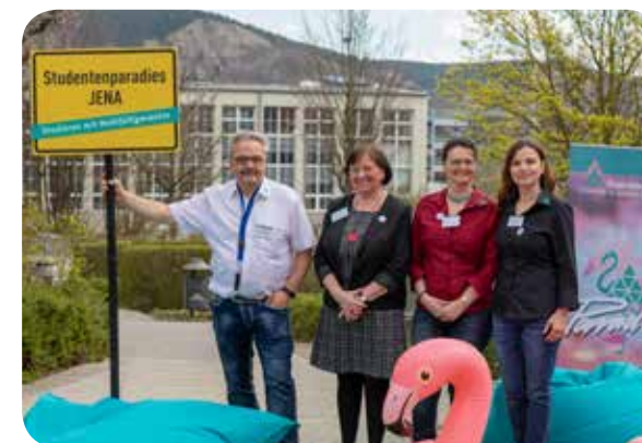
Ihr Team des Studierendensekretariates und des Master Service.

Wir wünschen Ihnen einen guten Start und eine erfolgreiche Studienzzeit!