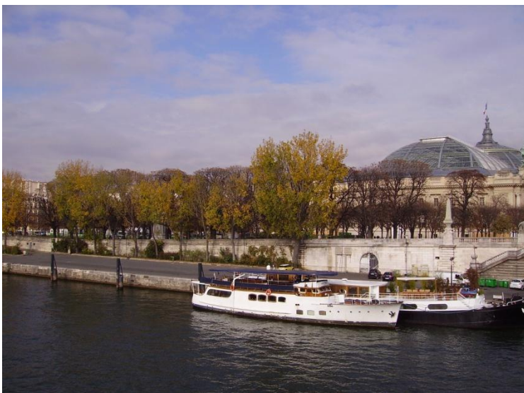
3 Seine und Grande Palais