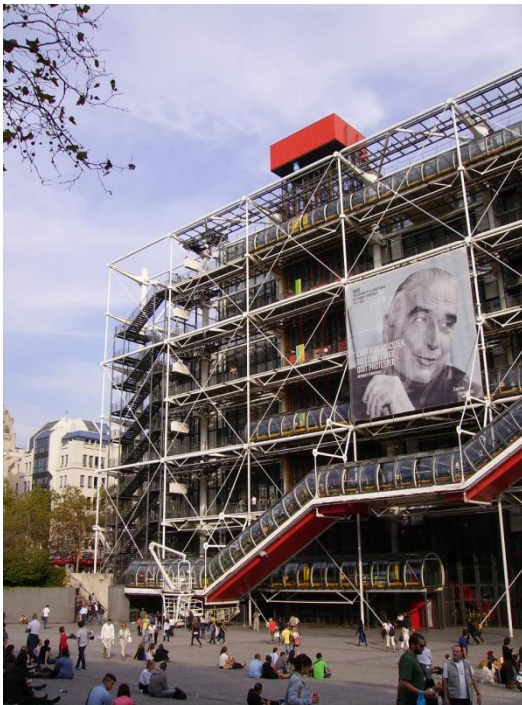
4 Centre Pompidou