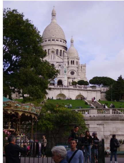
1 Sacre Coeur