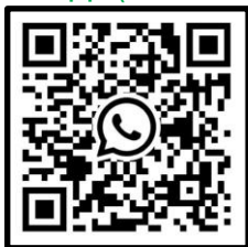
WhatsApp (SoSe 2024)