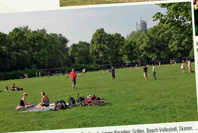
Stadtpark Jenaer Paradies: Grillen, Beach-Volleyball, Skaten, ...