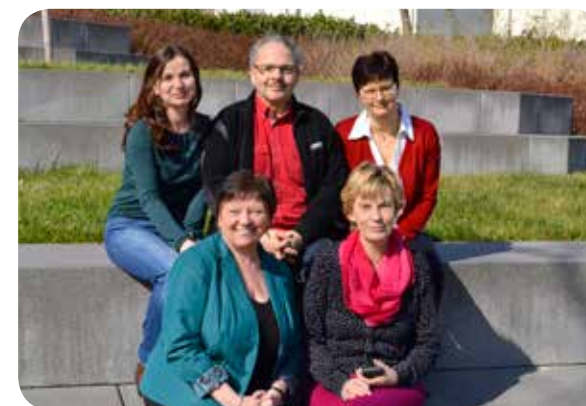
Ihr Team des Studierendensekretariates, des THOSKA-Büros und des Master Service.

Wir wünschen Ihnen einen guten Start und eine erfolgreiche Studienzzeit!